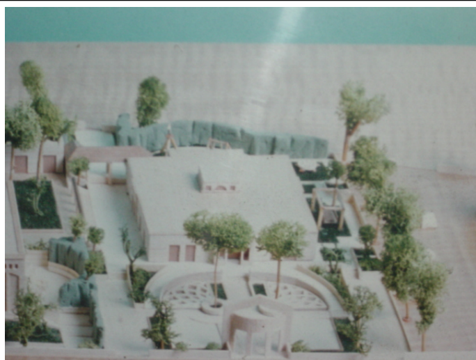
1. Immagine del plastico con particolare dell'asilo nido

Il presente progetto prevede la realizzazione dell'asilo nido, composto da due sezioni, oltre agli standard previsti dal R.R. 4/2007 e dal D.M. 18/12/75.